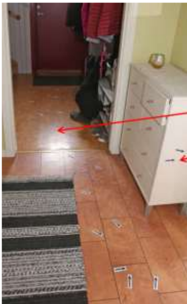
Hallen på markplan

Av beslagprotokoll och platsundersökning på Fågelsångsvägen framgår sammanfattningsvis att blod anträffats på markplan i villans hall och vid första trappsteget till övervåningen i form av avsatt blod och stänk.