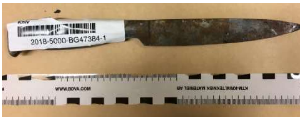
Fotografi på den vid fågeltornet anträffade kniven

Av protokollet över platsundersökning vid fågeltornet i Kalix genomförd den 6 maj 2018, framgår sammanfattningsvis att det på marken vid den sida av utkikstornet som vetter mot älven, låg brända föremål. Panelen ovanför föremålen var förkolnad. I brandresterna låg en del snö. Bland blandresterna identifierades bland annat ett knivblad, tre handdukar varav två säkrades, ett stålrör, som såg ut att komma från någon slags föremål, hårprodukter, bältesspänne, metallpyramider, delar som såg ut att komma från en väska, en medicinkarta Amlodipine, en nyckel, en kork, delar av en plastpåse, torkpapper och silvertejp. Blod iaktogs på handduken, torkpappret och på silvertejpen. Blodet på silvertejpen säkrades med tops. De blodiga föremålen låg i anslutning till varandra och det är möjligt att blod överförts mellan föremålen. Det fanns inget synligt blod på knivbladet. Knivbladet var bränt/sotigt.