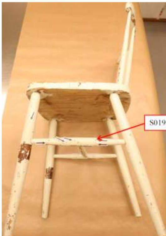
Fotografi på stolen

På golvet där stolen stod observerades blodstänk och en blodbesudling.