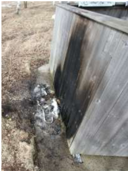
Fotografi av fågeltornets bas