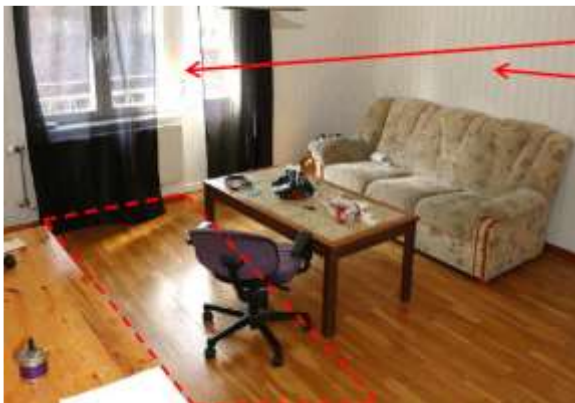
Rummet på Parkbältesgatan

Av protokollet över den kriminaltekniska undersökningen av lägenheten på Parkbältesgatan i Kalix framgår att blod anträffats dels i hallen, i form av avrinningar, avsatt blod och avstruket blod, dels på toaletten, i form av blodavrinning, avsatt blod, avstruket blod och blodstänk, dels i ett rum, i form av avrinning, blodstänk och bloddropp. I rummet fanns en golvyta som var renare än andra golv. Vid undersökningen av den renare golvytan med blodframkallningsmedel observerades mindre enstaka reagenser för blod.