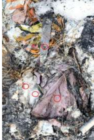
Fotografi av föremål vid tornets bas (Blod markerat med röda ringar)

Av beslagprotokoll och platsundersökning på Fågelsångsvägen framgår sammanfattningsvis att blod anträffats på markplan i villans hall och vid första trappsteget till övervåningen i form av avsatt blod och stänk.