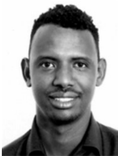
Foto och namnteckning från körkort tillverkat 2017-11-14