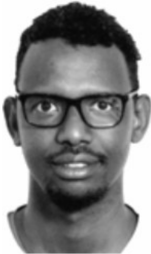
Foto och namnteckning från körkort tillverkat 2020-02-19