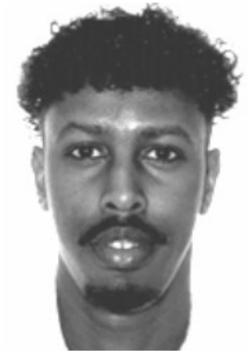
Foto och namnteckning från taxiförarlegitimation tillverkad 2021-07-15