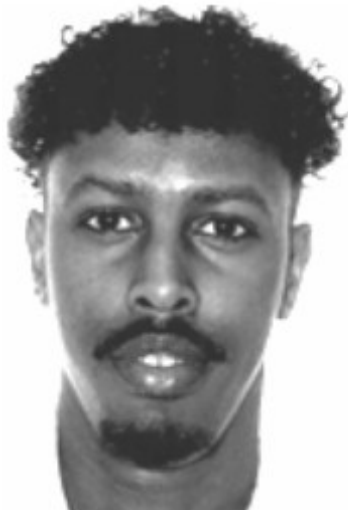
Foto och namnteckning från körkort tillverkat 2021-06-22