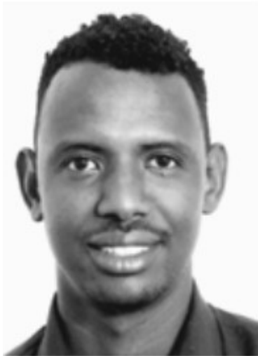
Foto och namnteckning från taxiförarlegitimation tillverkad 2017-11-13